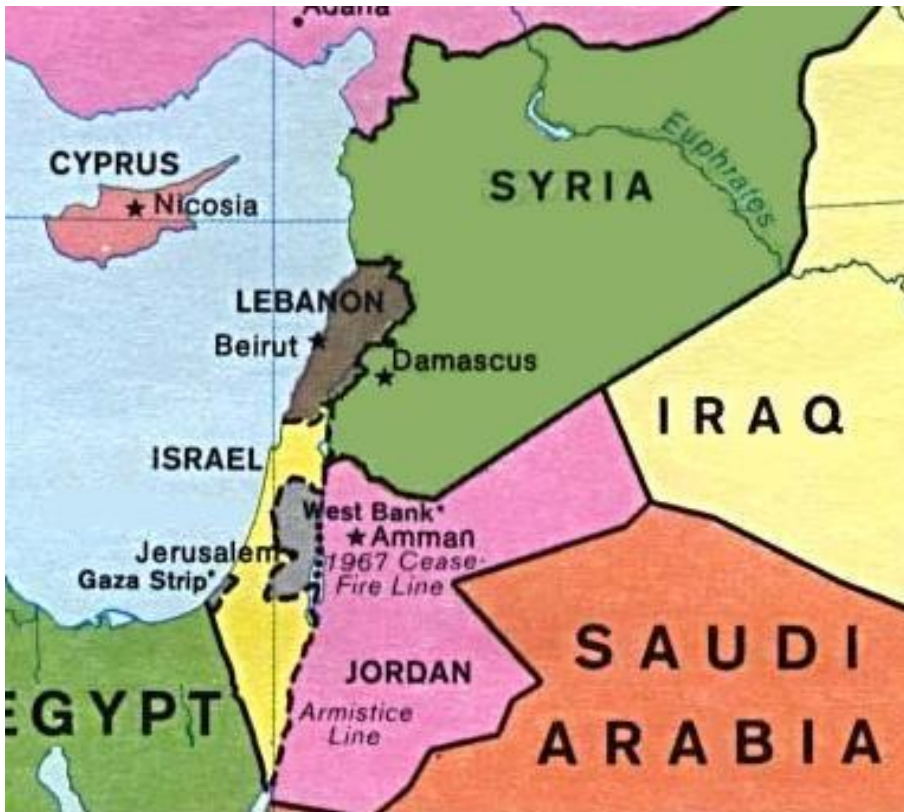
Harita1: Suriye Haritası

Bu bölgede bulunan Suriye, Asya, Avrupa ve Afrika kıtalarının kesişim bölgesinde yer almaktadır. Suriye'nin kuzeyinde Türkiye, doğu ve güneydoğusunda Irak, güneyinde Ürdün, güneybatısında İsrail, batısında Lübnan ve Akdeniz yer almaktadır. (Harita:1)