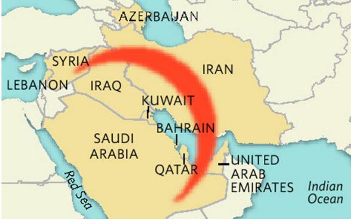
Harita 3:Şii Hilali

Ortadoğu'da Şii hilalini kapsayan ülkelerin jeopolitik konumları çok önemlidir. Petrol ve doğalgaz kaynakları açısından baktığımızda Şii toprakları bu bölgedeki toplam kaynağın %75ini oluşturmaktadır.